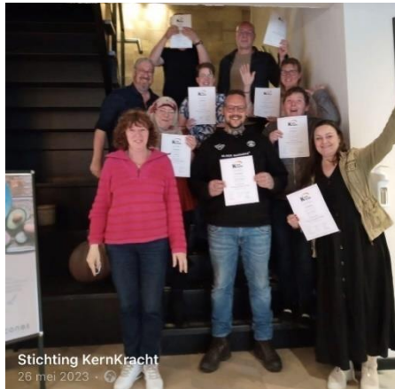
Groep Werken met eigen ervaring