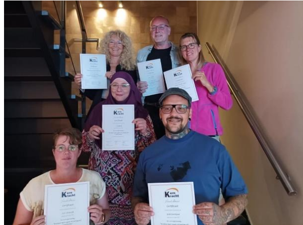
Groep getrainde voorlichters